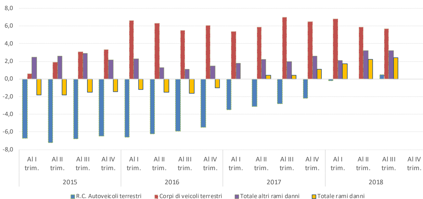
Variazioni % tendenziali dei premi contabilizzati danni, al trimestre

* Le variazioni % sono calcolate a perimetro di imprese omogeneo.