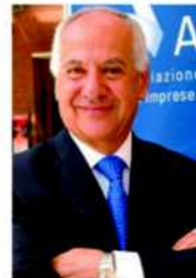
Fabio Cerchiai, presidente dell'Ania